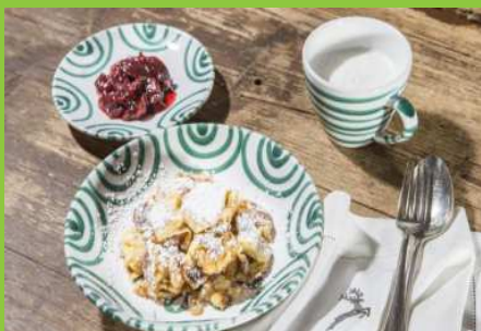
Círařský trhanec Kaiserschmarren