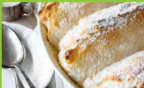
Salcburské noky Salzburger Nockerl