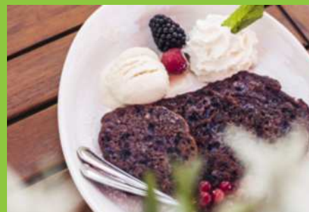
Sladké borůvkové placky Moosbeernocken