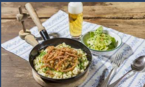
Sýrové noky Pinzgauer Kasnocken

V Zell am See-Kaprunu se můžete těšit na pestrou paletu chutí – včetně těch, které ocení vegetariáni a vegani, které jsou stejně bohaté a jedinečné jako zdejší krajina. Tradiční i inovativní kuchyně v Zell am See-Kaprunu je dokonalou kombinací vydatných a sladkých pokrmů, které jsou v místní kultuře hluboce zakořeněné.