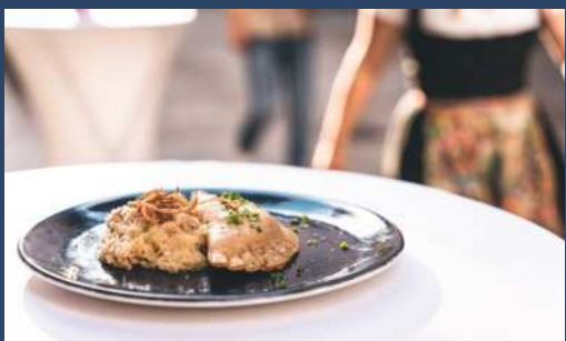
Plněné taštičky Pinzgauer Bladln